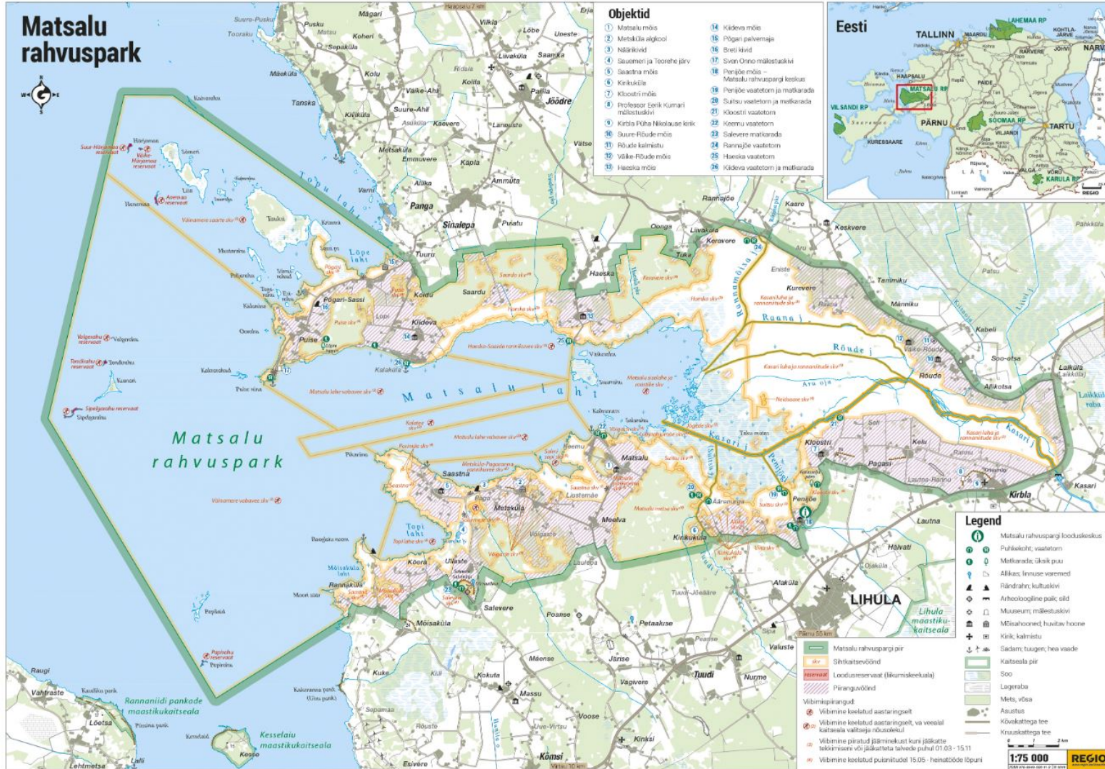
Joonis 1. Matsalu rahvuspark