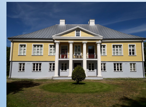
Matsalu rahvusparki külastuskeskus

Ühingu eesmärgiks on tagada ühingusse kuuluvate omavalitsuste tasakaalustatud areng turismi- ja puhkemajanduse arendamise ning muude piirkonna arengut toetavate, sh loodus- ja keskkonnakaitseliste tegevuste, ja projektide elluviimiste kaudu.